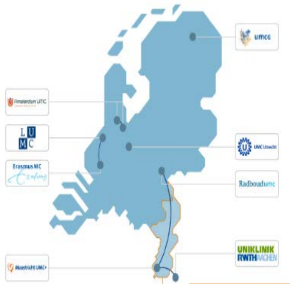
Samenwerking met Brightlands